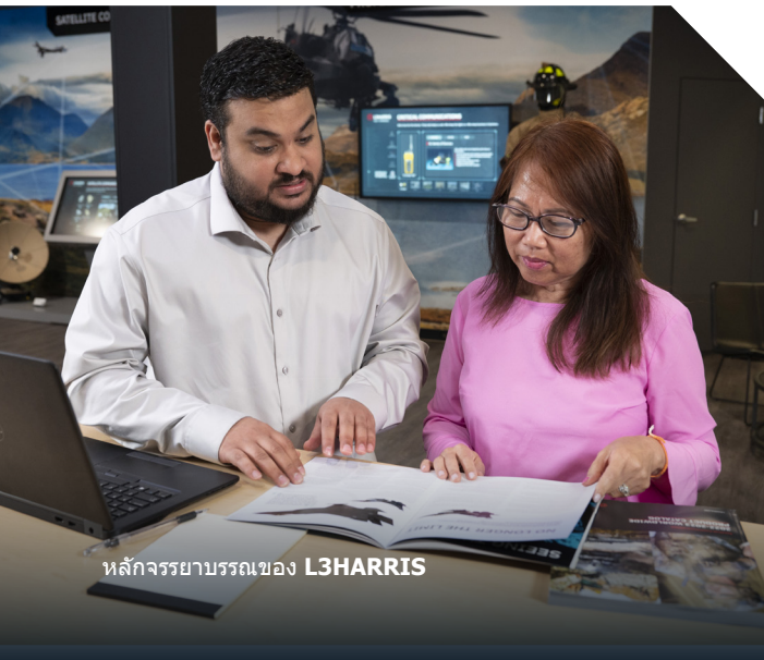
หลักจรรยาบรรณของ L3HARRIS