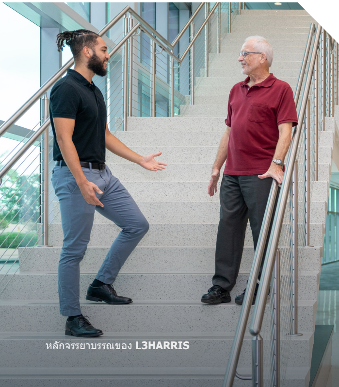
หลักจริยธรรมของ L3HARRIS

เราใช้แนวทางต่อต้านโดยเด็ดขาดกับการติดสินบนและการทุจริต เนื่องจากสิ่งเหล่านี้จะสร้างความเสียหายต่อชุมชนที่เราดำเนินธุรกิจและอาจสร้างความเสียหายกับ L3Harris เรามีหน้าที่รับผิดชอบในการปฏิบัติตามกฎหมายต่อต้านการทุจริตและกฎหมายต่อต้านการติดสินบน เช่น กฎหมายว่าด้วยการปฏิบัติที่เป็นการทุจริตในต่างประเทศของสหรัฐอเมริกา (FCPA) รวมถึงกฎหมายต่อต้านการทุจริตของประเทศใด ๆ ที่เราดำเนินธุรกิจอยู่ กฎหมายเหล่านี้ห้ามไม่ให้มีการเสนอ มอบให้ ร้องขอ หรือยอมรับสินบนหรือเงินใต้โต๊ะไม่ว่าในรูปแบบใด ๆ ทั้งในการเจรจาธุรกิจกับเจ้าหน้าที่รัฐ พรรคการเมือง หรือตัวแทนจากองค์กรการค้าก็ตาม